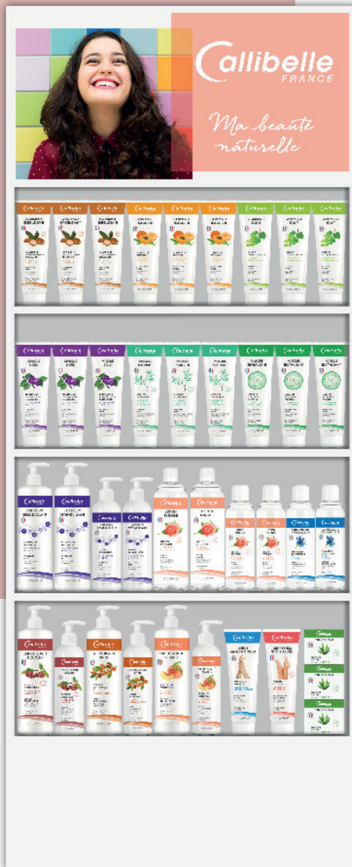
PRÉSENTOIR DE SOL / Free standing display