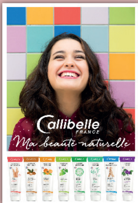
PANNEAU VITRINE / Window display